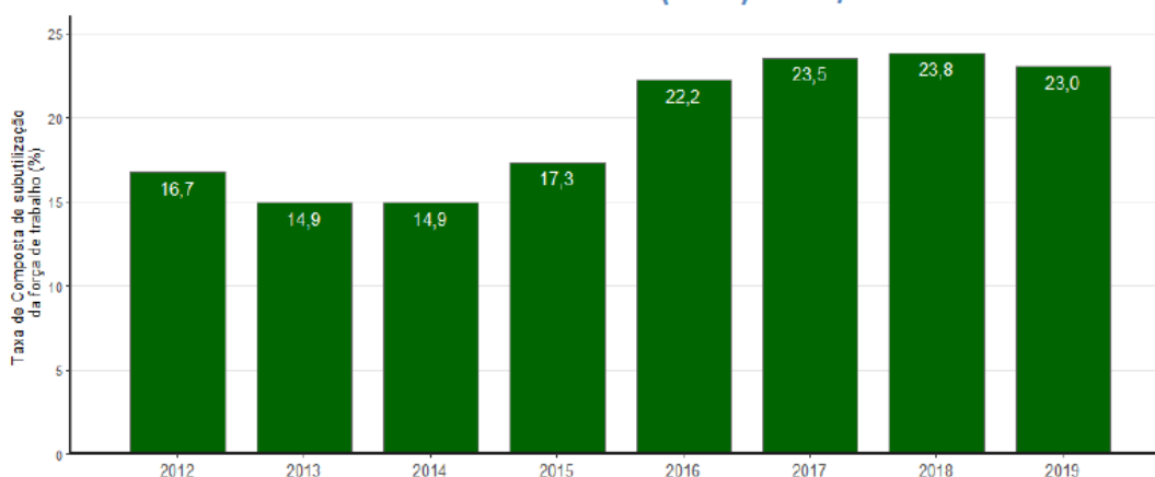
Taxa de Composta de subutilização da força de trabalho nos trimestres de outubro a dezembro - Brasil – (em %) - 2012/2019

Nota: A partir do 4º trimestre de 2015 houve mudança de conceito na subutilização da força de trabalho por insuficiência de horas trabalhadas. Anteriormente, considerava-se no cálculo do indicador as horas efetivamente trabalhadas e, a partir do referido trimestre, as habitualmente trabalhadas. Houve ainda mudança na forma de captação do quesito de horas trabalhadas.